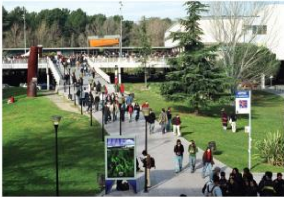
Un campus internacional saludable i sostenible