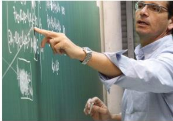
Una docència de qualitat