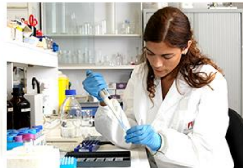
Una universitat líder en recerca