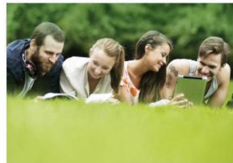
Una universitat solidària, participativa i cultural