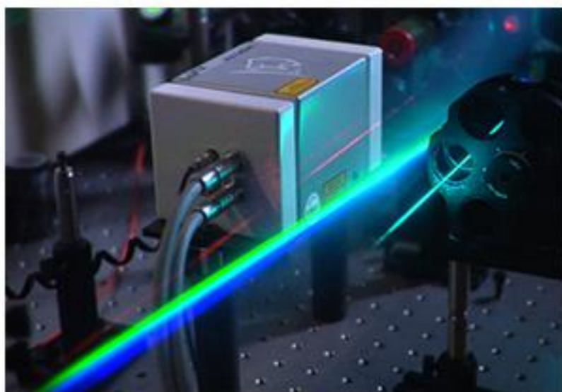
Una universitat que fomenta la innovació i l'emprenedoria