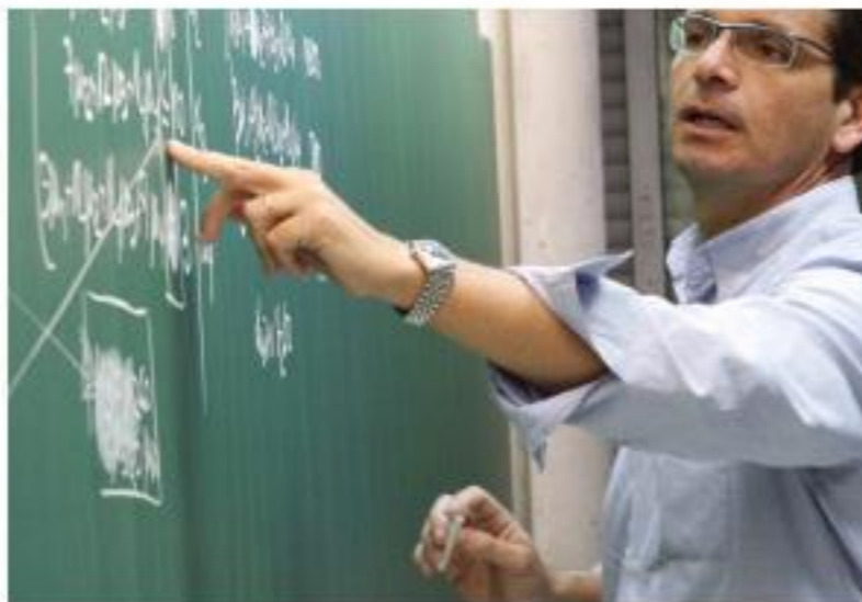
Una docència de qualitat