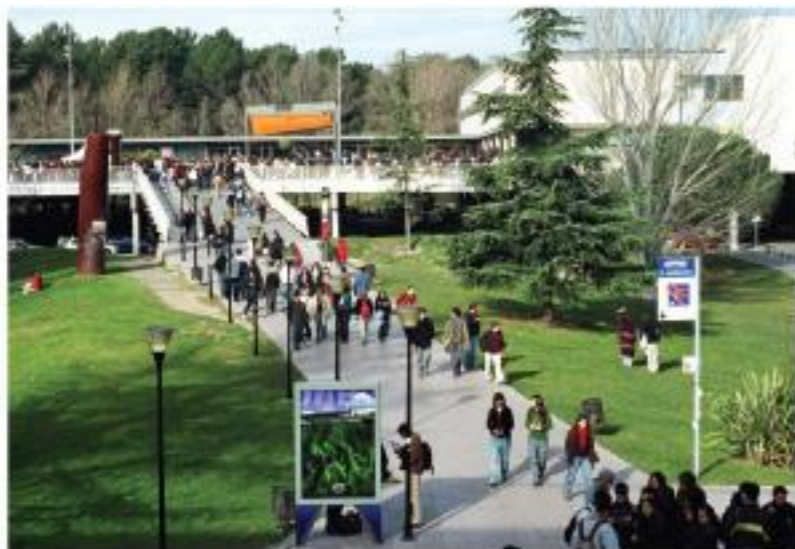
Un campus internacional saludable i sostenible